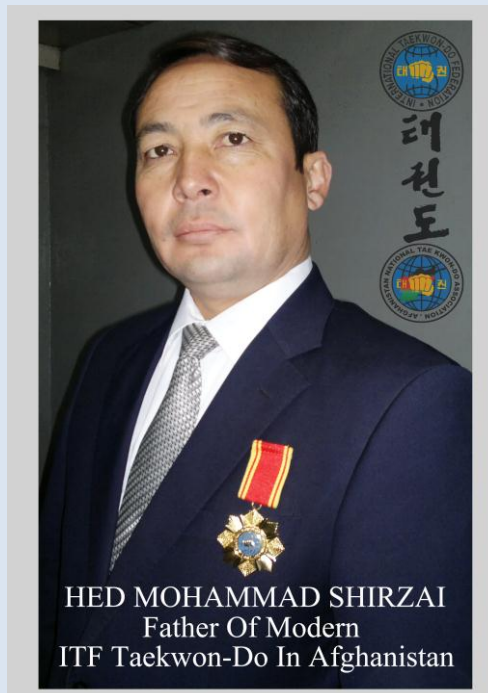
HED MOHAMMAD SHIRZAI Father Of Modern ITF Taekwon-Do In Afghanistan

فدراسيون بين المللى تکواندو بنام « آى ، تى ، اف » « ITF » رسماً در سال 1966 ميلادى توسط جنرال چوى هونگ هي ( Gen. Choi Hong Hi ) پدر و مبتکر تى کوان- دو اعلان گرديد و متعاقباً در سال 1973 ميلادى، فدراسيون دومى جهانى تکواندو تحت نام « آى ، تى ، اف » « WTF » نیز پا به عرصه فعاليت گذاشت.