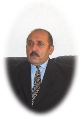
نوشته کریم پوپل